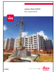
Leica Viva GS15