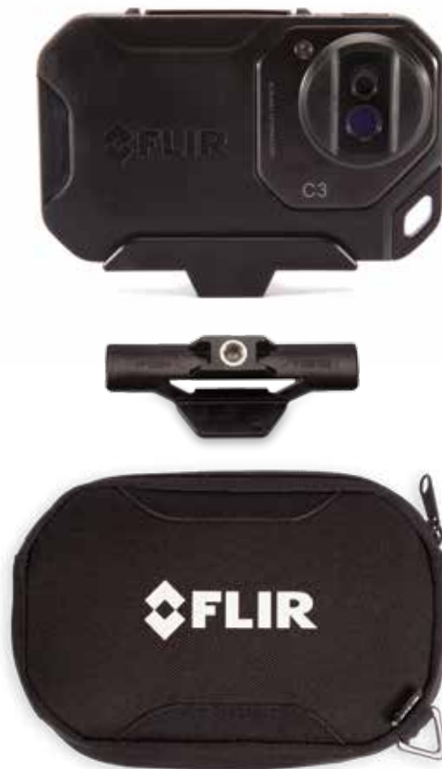
FLIR C3 con montaje para trípode y bolsa de transporte

Las especificaciones están sujetas a cambios sin previo aviso. Para consultar las especificaciones más recientes, visite www.flir.com