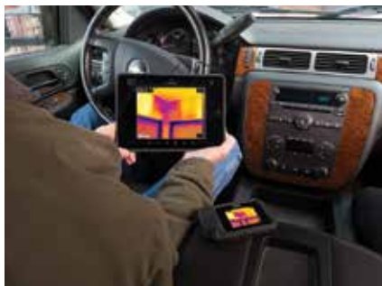
Cargue imágenes a FLIR Tools por wifi