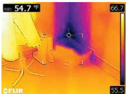
El cuadro de área con puntos fríos muestra la infiltración de aire