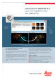
Leica Cyclone REGISTER